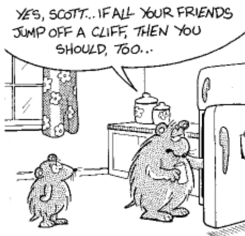
PARENTING FOR LEMMINGS

Tot slot: Ergens in de eerste dagen van april wordt er vergaderd over jouw (voorlopige) profielkeuze. Hier kan een advies uitrollen wat af kan wijken van jouw keuze. Je mentor zal dit met je bespreken. Om ervoor te zorgen dat je tussen 7 april en uiterlijk 10 april toch een definitieve keuze kan maken waar je zelf achter staat, hebben de decanen op 4 april spreekuur speciaal voor klas 3. Maak daar gebruik van! Bespreek het daarna ook thuis of met je docenten en pas indien nodig je plan aan. Latere aanpassingen zijn heel erg moeilijk of zelfs onmogelijk.